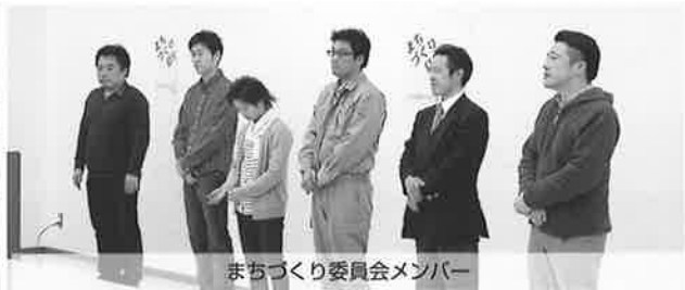
まちづくり委員会メンバー